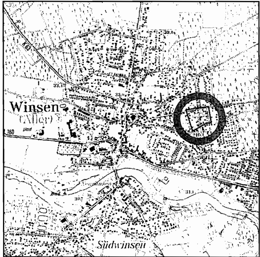
ÜBERSICHTSKARTE M 1: 25.000