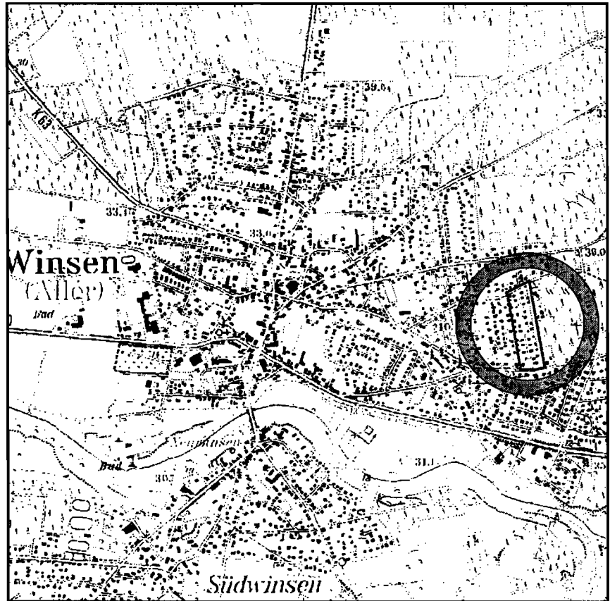
ÜBERSICHTSKARTE M 1: 25.000