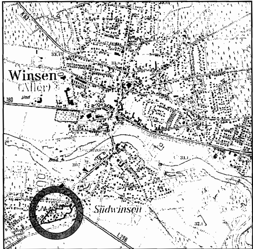
ÜBERSICHTSKARTE M 1: 25.000